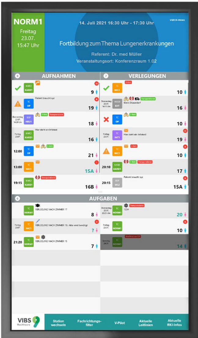
▲ ABBILDUNG 1 Das zentrale VIBS9-Terminal informiert über Patientenaufnahmen, Verlegungen und allgemeine Aufgaben. Der V-Pilot kann als optionales Modul integriert werden und ist im Footer-Menü der Software anwählbar.